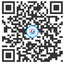
网球基本功大赛报名二维码

2. 报名方式：请扫描以下报名二维码进行报名，资格审核后确认，纸质报名表自行打印盖章后报到时交组委会。